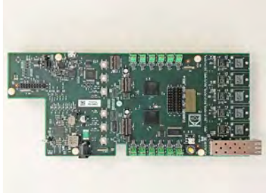
Bild 1: KDPOF implementiert NXP SJA1110 SoC in neuen Automotive-Ethernet-Switch für Highspeed-Konnektivität