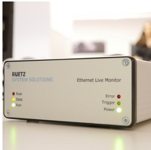
Imagen 1: El Ethernet Live Monitor identifica los errores correspondientes en la transmisión en vivo y activa el registrador de datos.